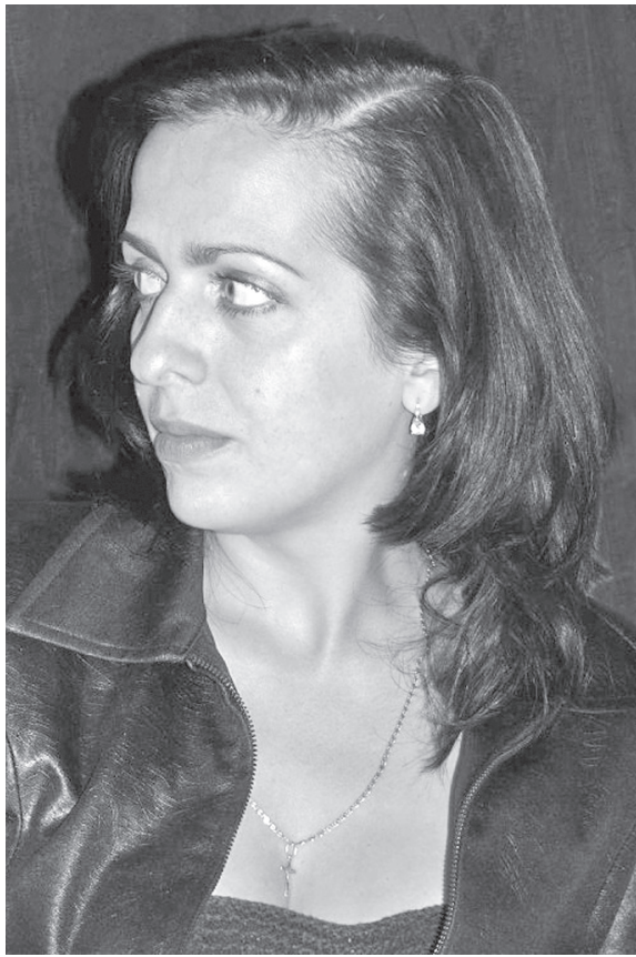
Разговор с матерью (писалось как песенный текст)

Столько лет осыпали вы нас проклятьями, всё святое херя, столько лет убеждали вы, что не братья мы – получилось, верю.